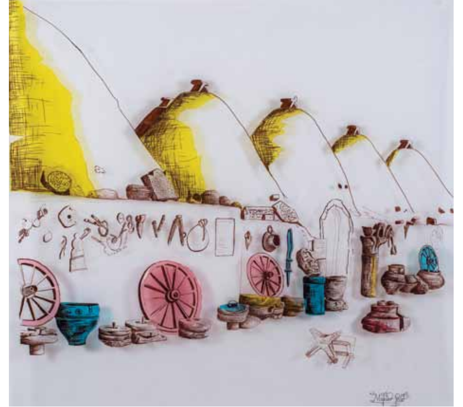
Kadının İç ve Dış Dünyası, 2015, Çizgi, Leke/Renkli Asetat Kalemler, Şeffaf Asetat, 100x100 cm

2014 yılından itibaren EKAV Vakfından burs almaya devam etmektedir.