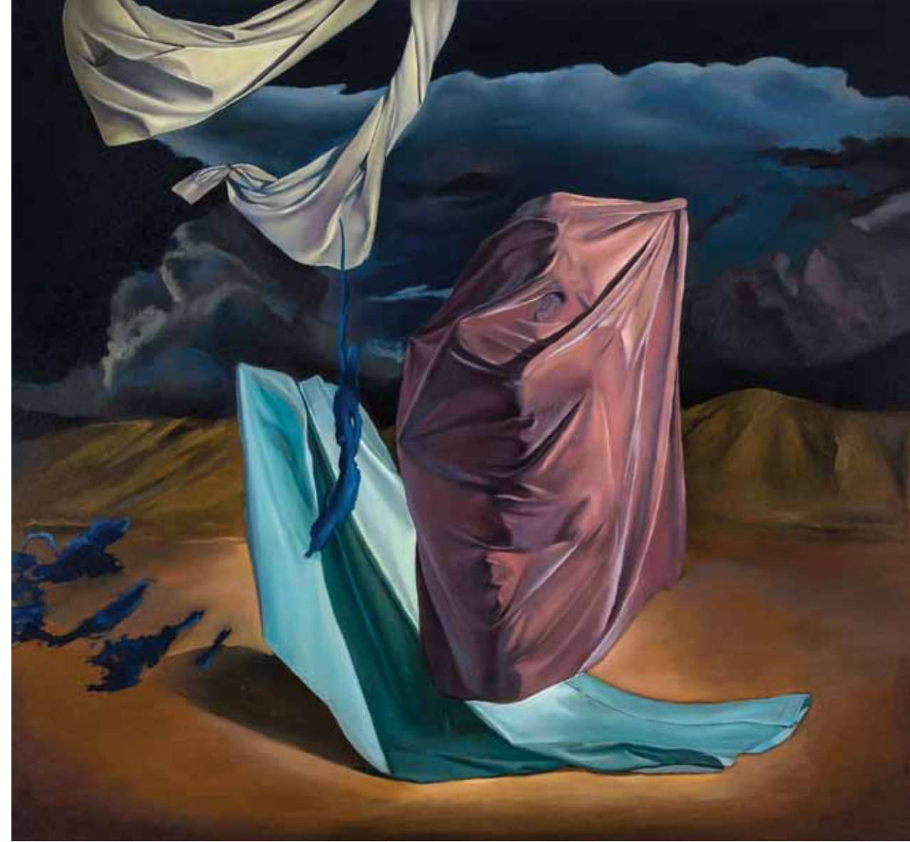
İsimsiz, 2015, Tuval zerine yaęlıboya, 140x150 cm

2010 yılından itibaren EKAV Vakfından burs almaya devam etmektedir.