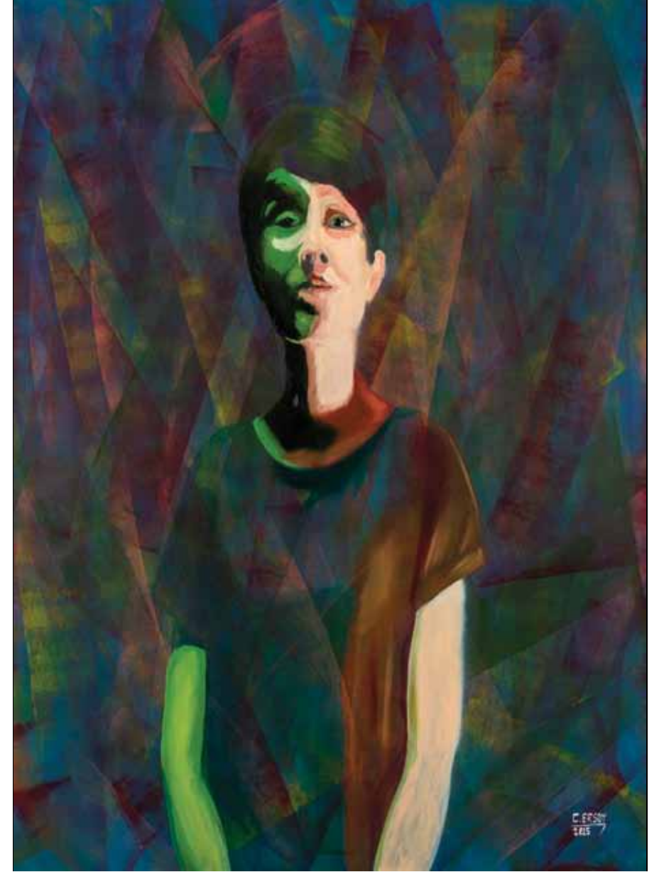
Beyzuk, 2015, Tuval üzerine karışık teknik, 146 x 114 cm

2010 yılından itibaren EKAV Vakfından burs almaya devam etmektedir.