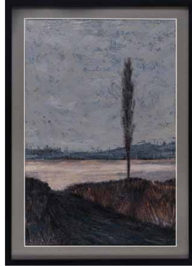
İsimsiz, 2013, Tuval üzerine yağlıboya, 21x28 cm İsimsiz, 2013, Tuval üzerine yağlıboya, 41x57 cm

2010 yılından itibaren EKAV Vakfından burs almaya devam etmektedir.