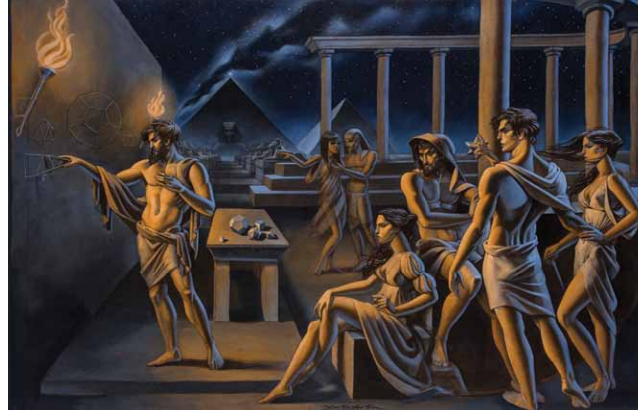
Mısır Ezoterik Okulu, 2015, Tuval üzerine karışık teknik, 250x162 cm

2000-2004 Tarihleri arasında EKAV bursu almıştır.