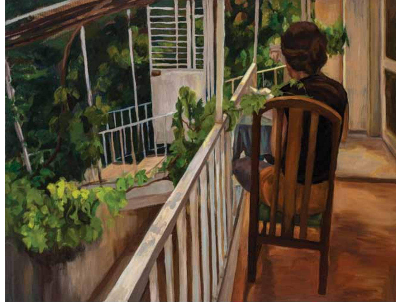
İsimsiz, 2014, Tuval üzerine yağlıboya, 70x100 cm

2010 yılından itibaren EKAV Vakfından burs almaya devam etmektedir.